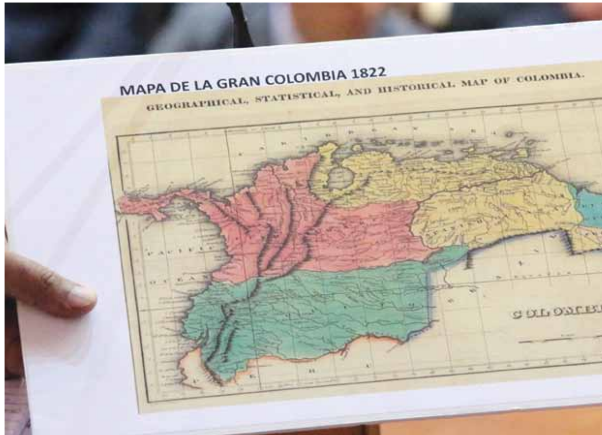
Presidente Maduro mostró varios mapas, como este de la Gran Colombia (1822) donde aparece el Esequibo como parte de nuestro territorio

conducta al contrario ha privilegiado en volver nuestras relaciones sobre la base de la construcción de una nueva confianza mutua entre países, dirigentes, pueblos; acompañar nuestras relaciones sobre la base de una poderosa cooperación energética, comercial, económica, cultural, sobre la base de un diálogo permanente entre las cancillerías, los presidentes.