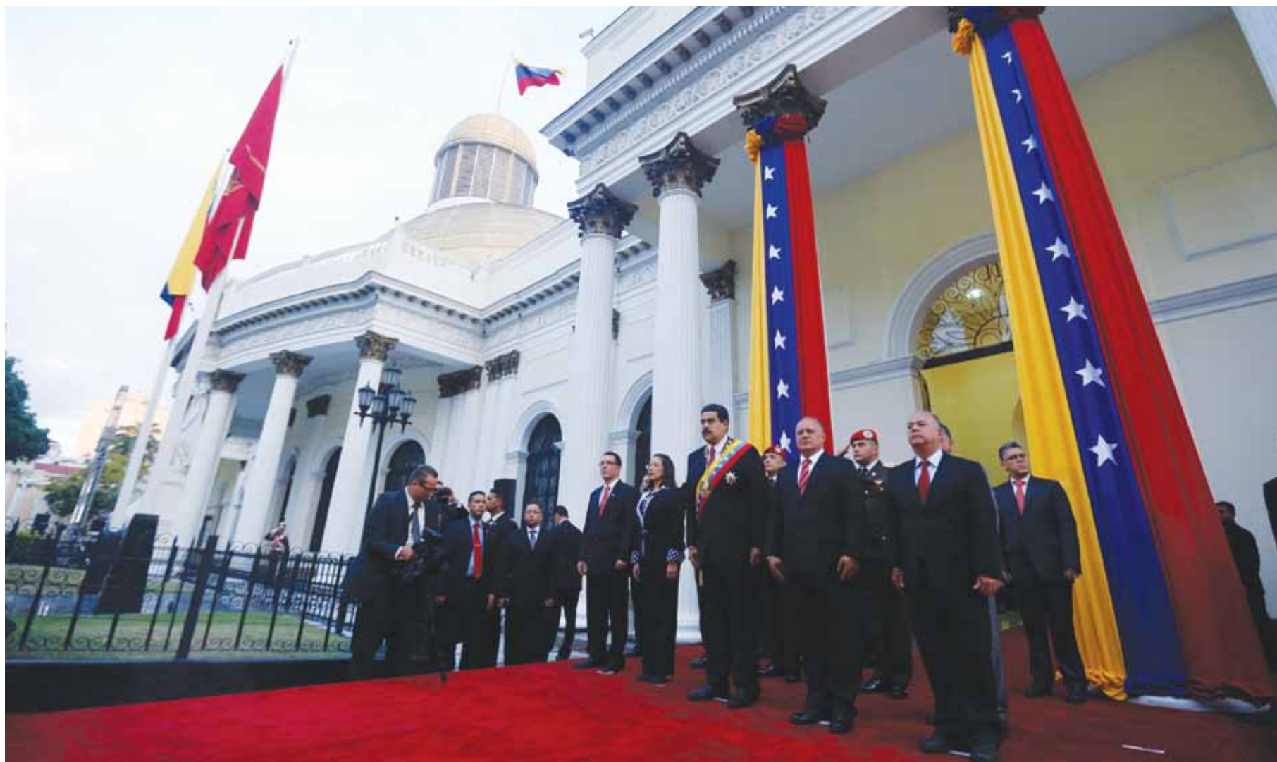
El presidente Nicolás Maduro recibió el respaldo de la directiva de la Asamblea Nacional y de los otros Poderes Públicos y militares